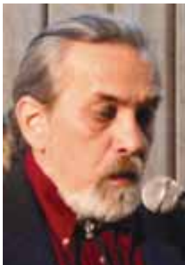
Vlașin – Giurgiu