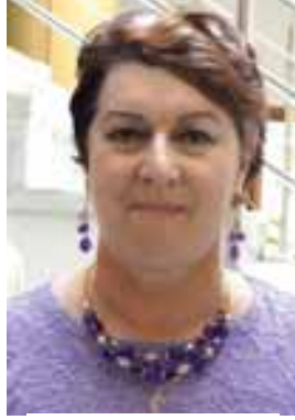
Drăgănești – Olt