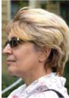
Fieni – Dâmbovița