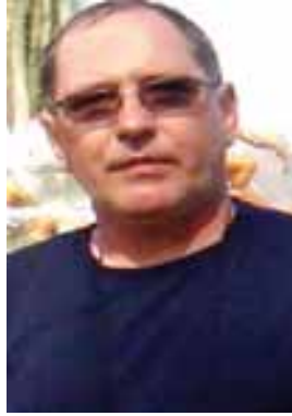
Corbu – Constanța