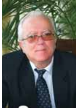
Orăștie – Hunedoara