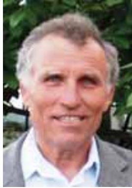
Corbu – Constanța