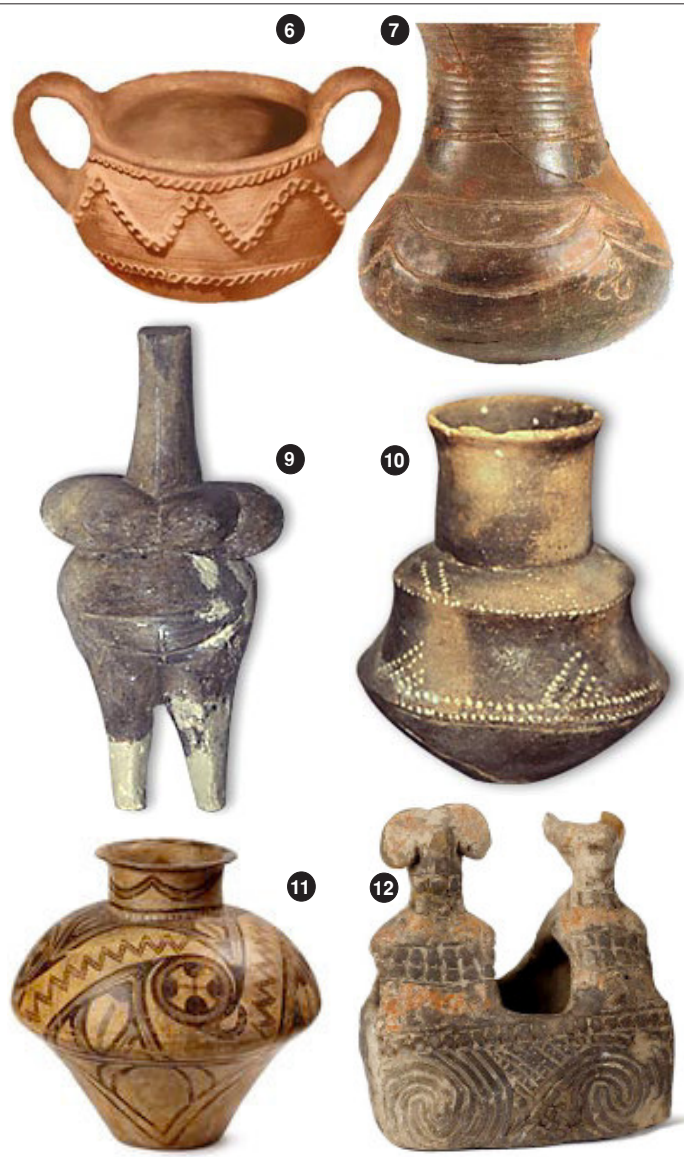
6). «Cultura Gârla Mare» developed around 1500 B.C. in the plains of Western Romania and Eastern Hungary. It appears that the pots were formed by hand, without a potter's wheel. The pots were reinforced with bands of clay. The decorations were indentations in the bands. A similar technique of reinforcing large pots with bands of clay was employed in the Austro-Hungarian Empire until the late 1800s.

La rândul meu, mă întreb: ce contează 50 de ani de comunism în comparație cu cele nouă milenii de istorie românească?