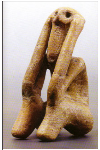
„The Thinker of Tarpești” Pre-Cucuteni 4750-4500 BC Illustration taken from „Cucuteni - The Last Great Chalcolithic Civilization of Europe” by Romanian Ministry of Culture, Romanian Academy, & Hellenic Ministry of Culture (1997)

Renașterea italiană apare ca o consecință clară și directă a căderii Constantinopolului (1453), cu emigrarea în masă a savanților Bizantini către Italia. De exemplu, numai Cosimo de Medici