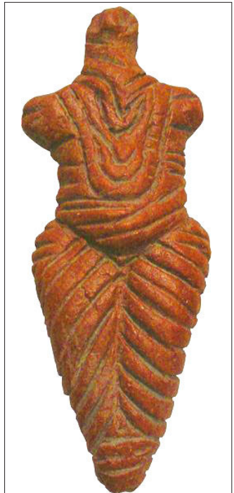
Venus de Roumanie, Culture de Cucuteni, Néolithique, ca - 5000 BC